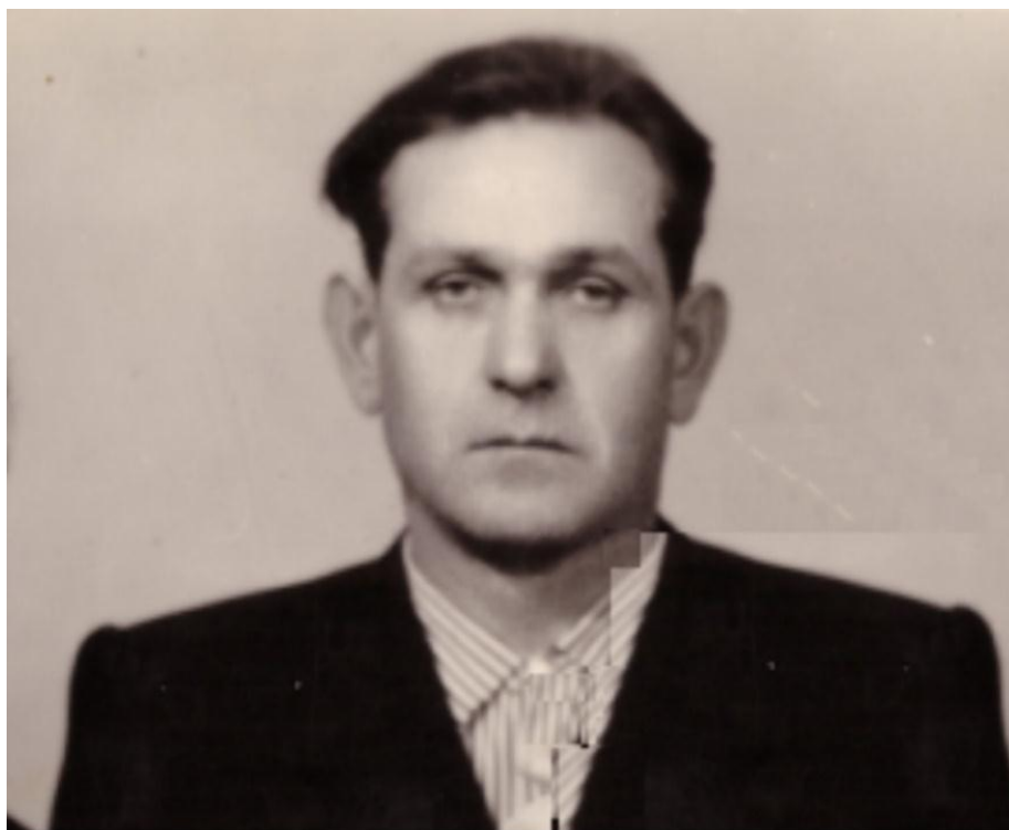
Землянко Тимофей Емельянович

Землянко Тимофей Емельянович (1918 – 1981) родился в Брянской обл. Учился в военном училище. Началась Великая Отечественная война, и он в звании сержанта был призван, не окончив училища. Прошел войну от начала до конца. Воевал на Украинском фронте.